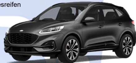
Abbildung zeigt exemplarische Modellreihe. Farbe und Modelllinie können abweichen.